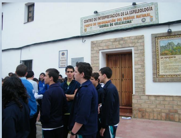
Centro de espeleología de Montejaque

ADEMÁS por su situación respecto a otras poblaciones importantes de la provincia o de Andalucía occidental: Cádiz, Jerez y Sevilla. Podemos acercarnos y ofreceros algunos de sus recursos históricos, culturales o recreativos: playas, vaporcito del Puerto, espectáculo como bailan los caballos andaluces, Giralda de Sevilla, etc. Incluso a propuesta de un grupo hemos visitado la Alhambra en Granada.