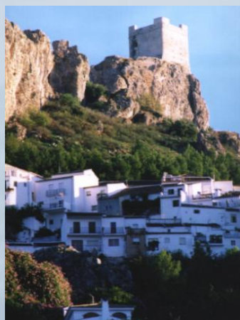
Ciudad medieval de Zahara de la Sierra

* A equipamientos de uso público: Jardín botánico en el Bosque, Museo El Hombre y la Sierra en Benaocaz, Eco-museo del agua en Benamahoma, centro de interpretación de la ciudad medieval de Zahara, centro de interpretación de la Espeleología de Montejaque.