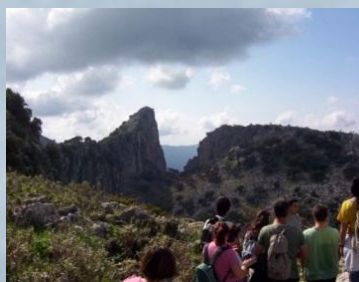
Panorámica del Salto del Cabrero en la ruta del Puerto del Boyar a Salto del Cabrero

IMPORTANTE: Para realizar los senderos del PN es necesario que el autobús acompañe al grupo durante todo el día.