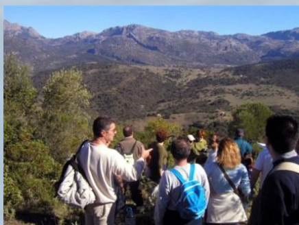
Panorámica de la Sierra del Endrinal vista desde el Monte Higuierón.